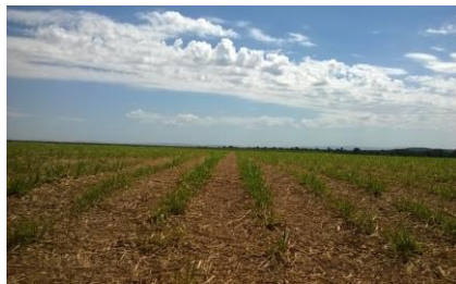
Ilustración: Paja residual en el campo