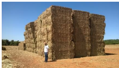
Ilustración: Conjunto de fardos a la espera de ser transportados a la usina