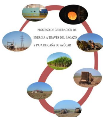
Proceso de generación de energía de la UOL

En la ilustración se puede ver el proceso llevado a cabo en la Unidad Otávio Lage que transforma el bagazo y la caña de azúcar en energía eléctrica, desde la cosecha de la caña de azúcar, el alineado de la paja del campo, su enfadamiento, transporte a la usina, preparado para incinerar, incineración, transformación en energía eléctrica y distribución al SIN.