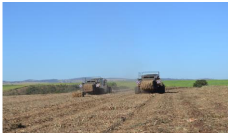
Ilustración: Enfardadoras recogiendo la paja y enfardándola

En la ilustración se puede apreciar la paja que queda en el campo luego de la cosecha de la caña de azúcar, las cantidades de este material dependen en gran medida de la zafra y llegan a alcanzar cantidades de 4 a 9 toneladas por hectárea.