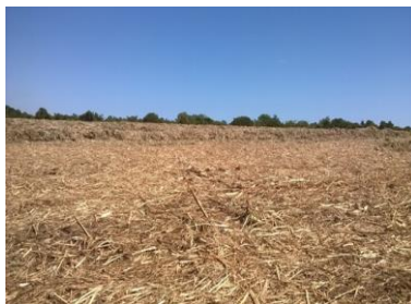
Paja residual en campo después de la cosecha de la caña de azúcar

Los equipos utilizados para alinear, enfardar y transportar la paja se muestran en las ilustraciones.